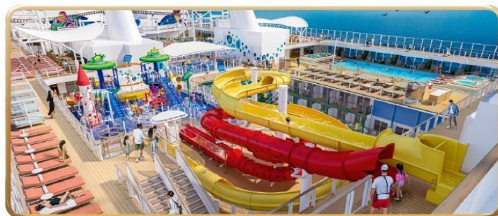
Toy Story Place