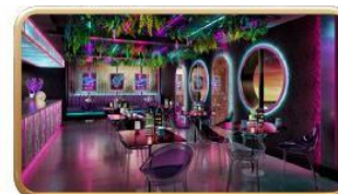
Bewitching Boba & Brews