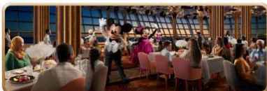
Hollywood Spotlight Club