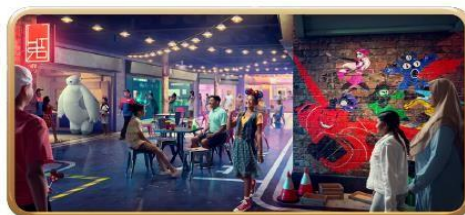
San Fransokyo Street