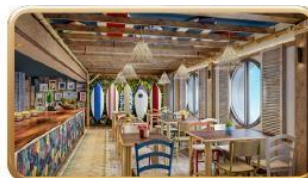
Stitch's 'Ohana Grill