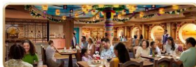
Enchanted Summer Restaurant