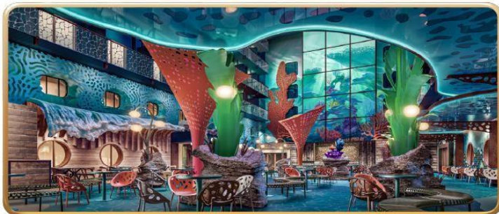
Disney Discovery Reef