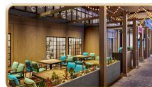
Mike & Sulley's