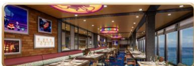
Pixar Market Restaurant